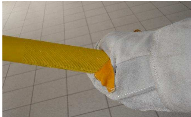
Extremos moleteados para un mejor agarre