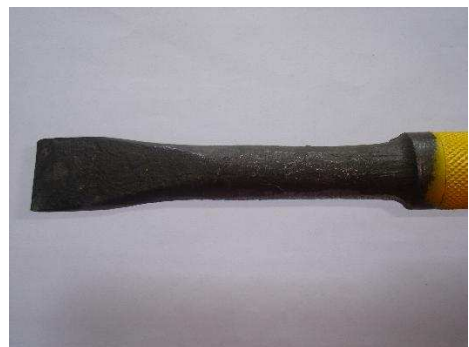
PUNTAS EN ANGULO